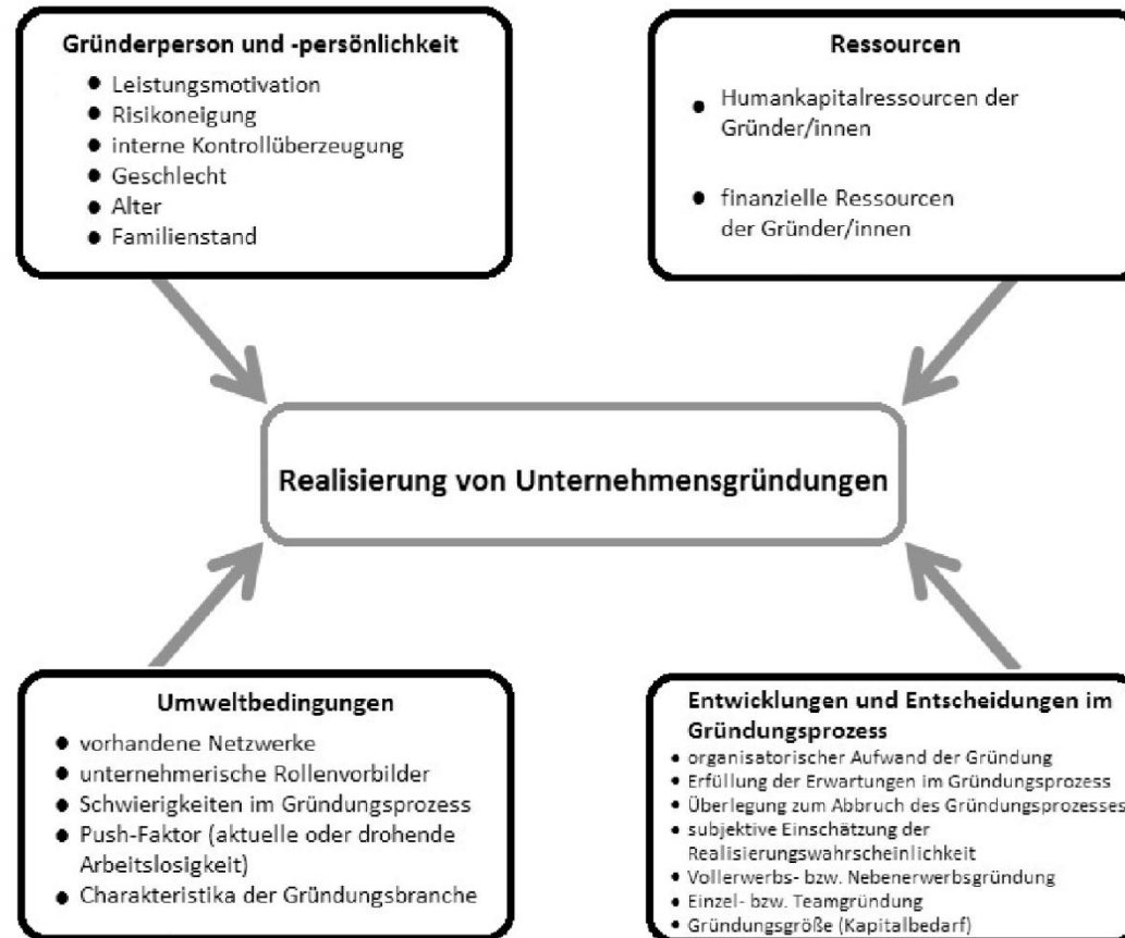
Abbildung 1: Determinanten der Realisierung von Unternehmensgründungen